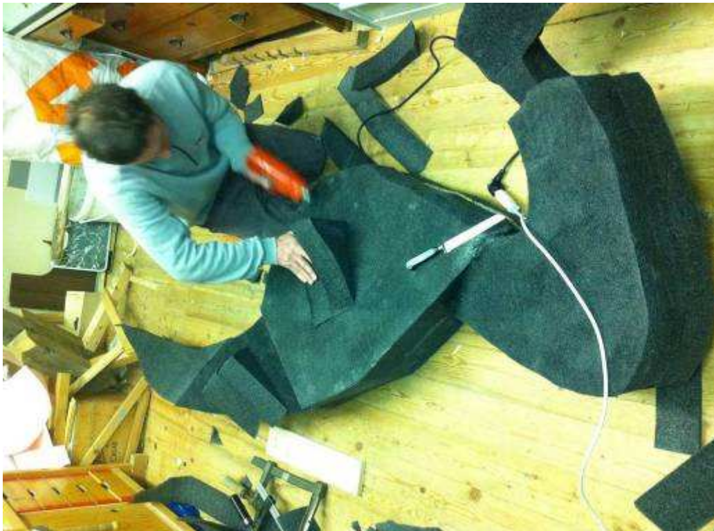
schnick schnack anschmelzen