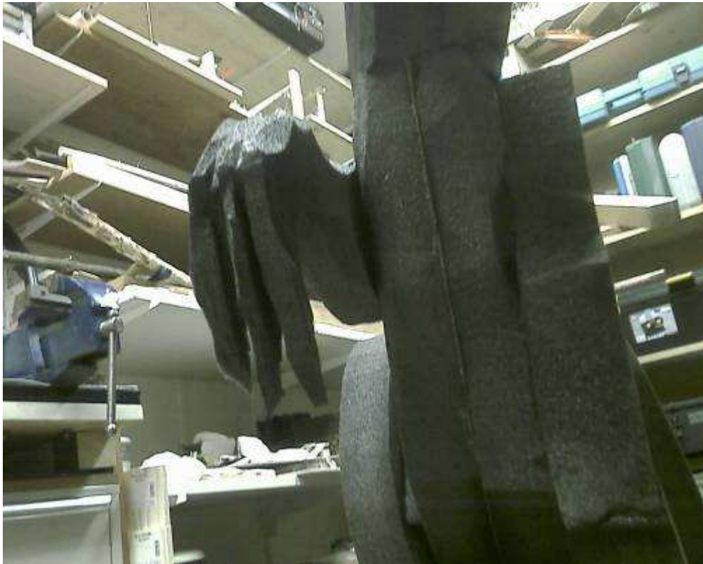
detail der hand (wird vermutlich schon beim transport zerstört)