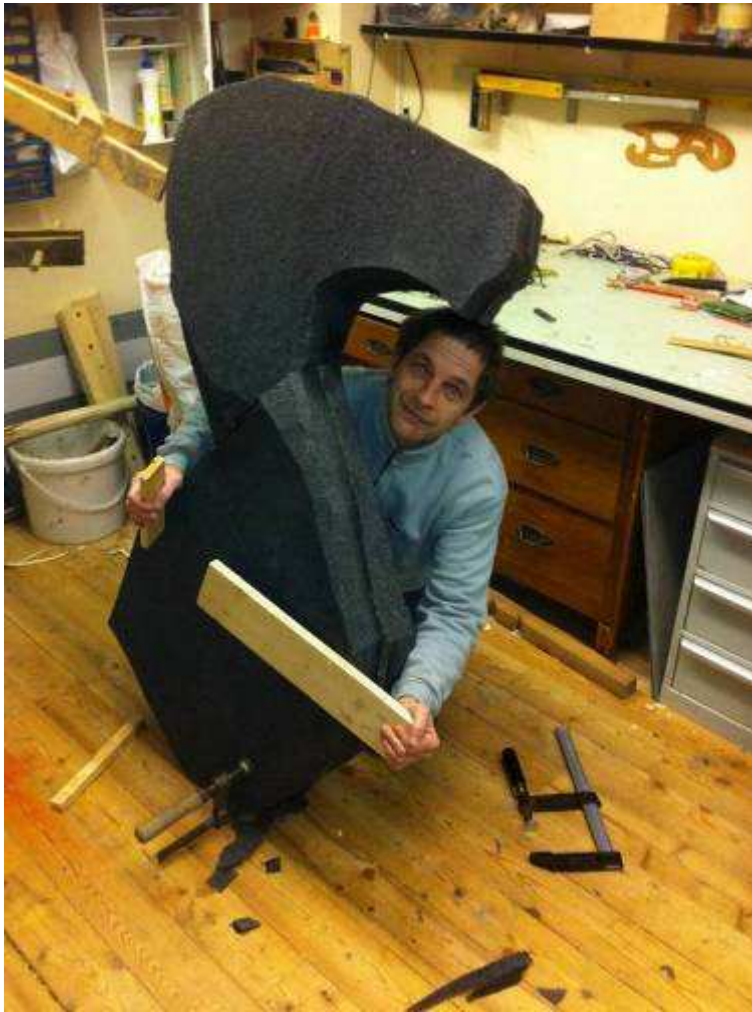
mit heissluftföhn verkleben