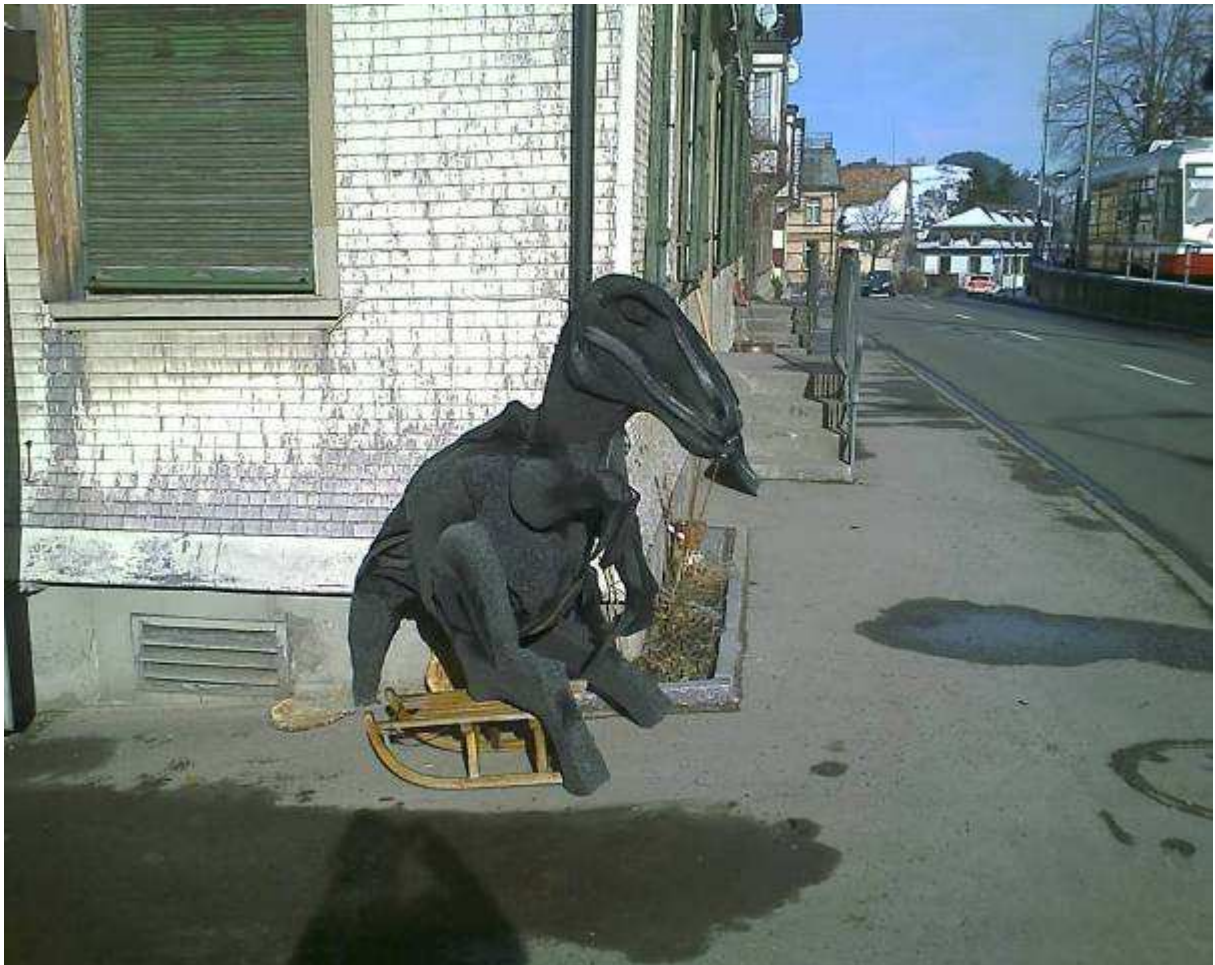
wartet auf beute...oberflächen und endbehandlung an der frischen luft